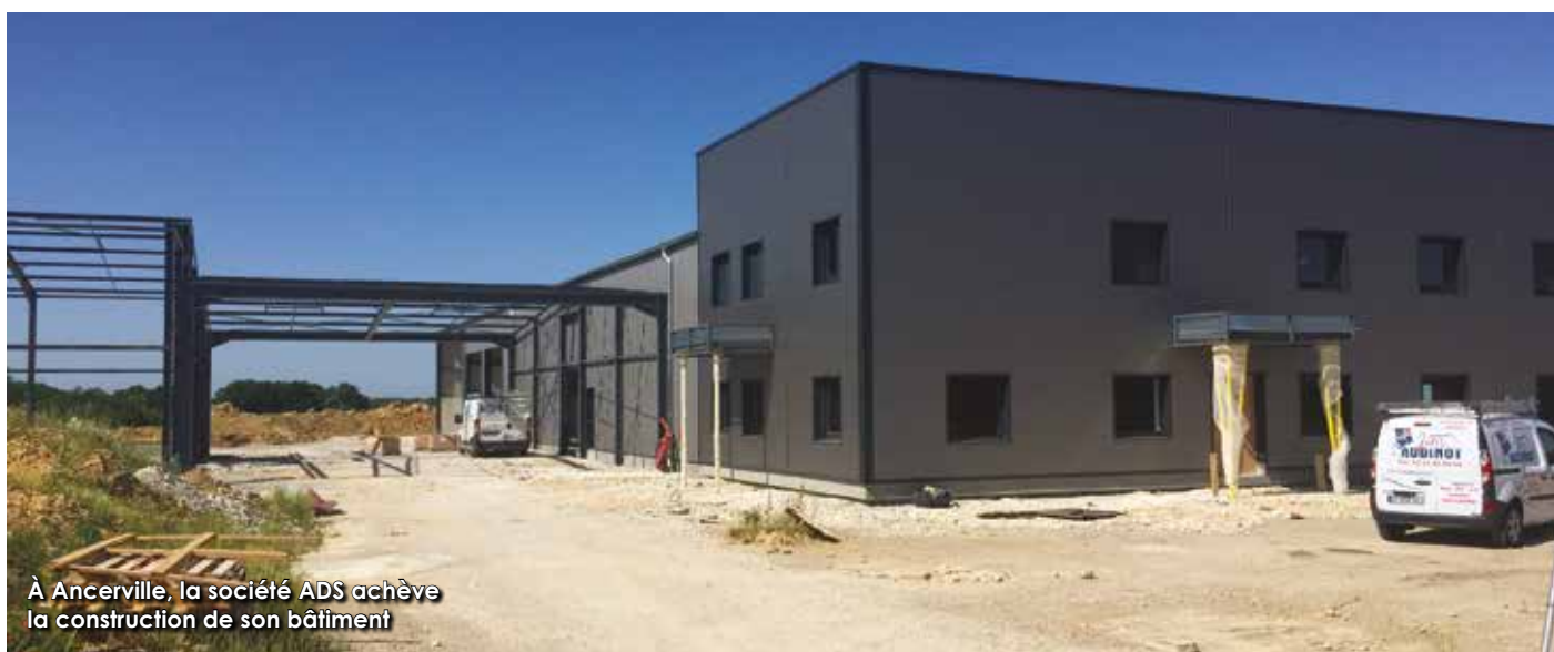
À Ancerville, la société ADS achève la construction de son bâtiment

La Zone d'activité économique de la Tannerie abrite une vingtaine d'entreprises et s'étend sur 7,5 hectares. Avec l'extension de la zone de la Forêt, ce sont potentiellement 12 hectares supplémentaires qui commenceront à accueillir de nouvelles entreprises sur le sol des Portes de Meuse, zone qui pourrait donc loger entre 25 et 30 sociétés.