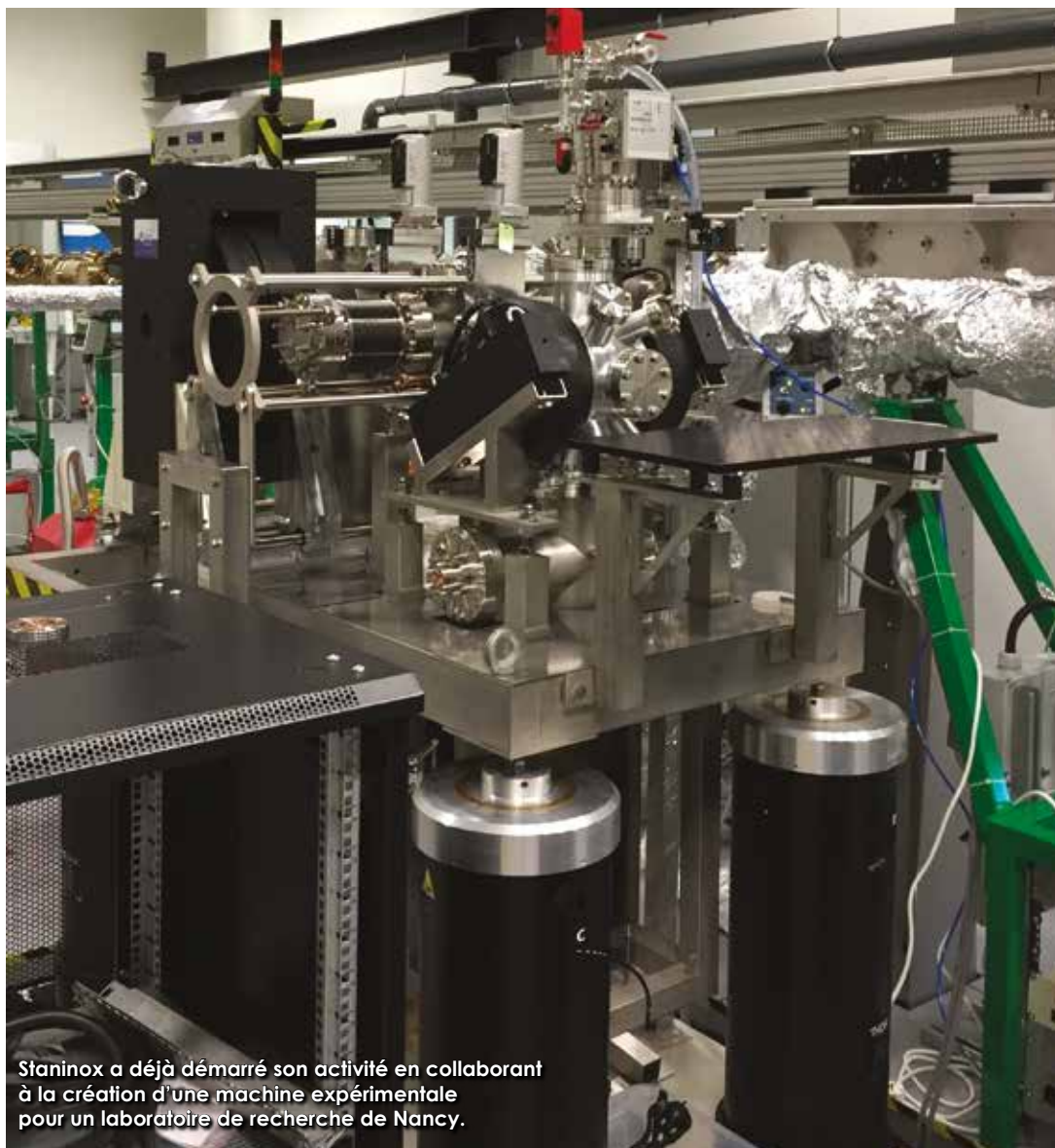
Staninox a déjà démarré son activité en collaborant à la création d'une machine expérimentale pour un laboratoire de recherche de Nancy.