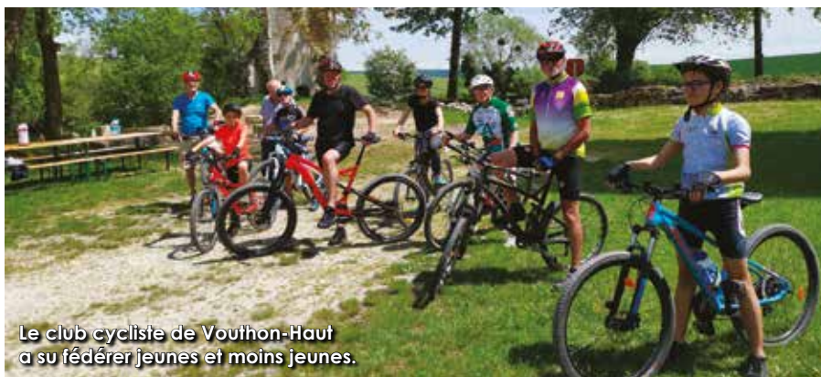
Le club cycliste de Vouthon-Haut a su fédérer jeunes et moins jeunes.

En 2019, la Communauté de Communes des Portes de Meuse subventionne 21 projets et a mis en place plusieurs conventions d'objectifs, pour une enveloppe totale de 149 000 €.