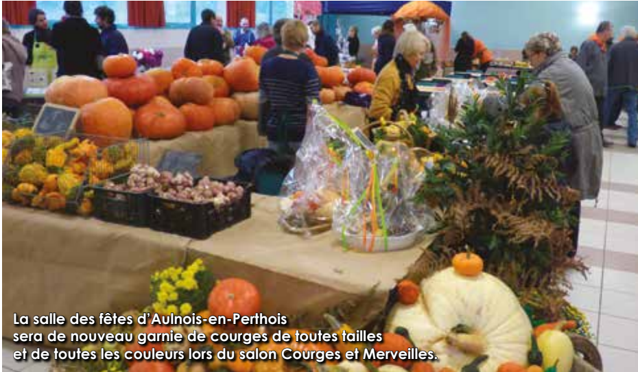
La salle des fêtes d'Aulnois-en-Perthois sera de nouveau garnie de courges de toutes tailles et de toutes les couleurs lors du salon Courges et Merveilles.