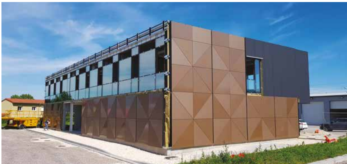
Construction de la future pépinière d'entreprises intercommunale à Gondrecourt-le-Château.