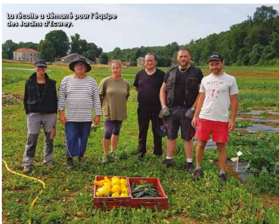
La récolte a démarré pour l'équipe des Jardins d'Écurey.