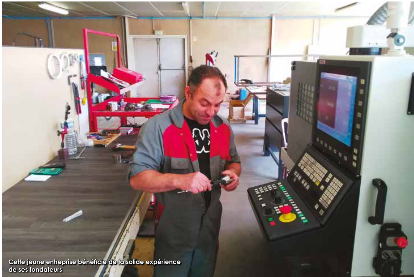
Cette jeune entreprise bénéficie de la solide expérience de ses fondateurs