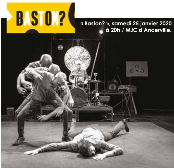
« Baston? », samedi 25 janvier 2020 à 20h / MJC d'Ancerville.