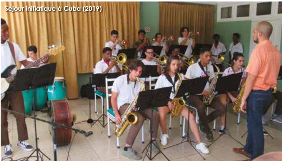
Séjour initiatique à Cuba (2019)

De retour de leur voyage à Cuba, les élèves de l'École Intercommunale de Musique et leurs accompagnateurs ont vécu non seulement un moment historique, mais aussi riche d'enseignements.