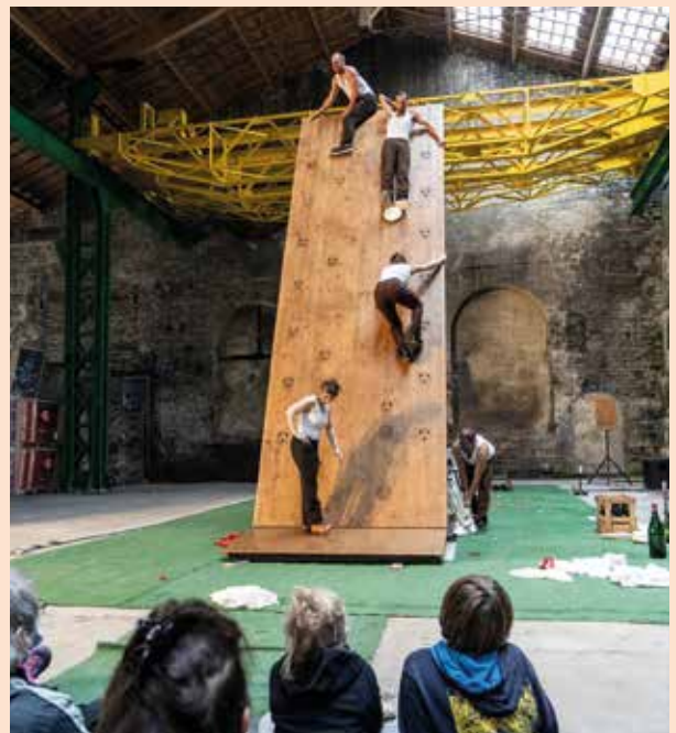
Spectacle Versants – Cie Underclouds.