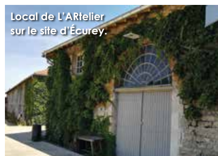
Local de L'Artelier sur le site d'Écurey.