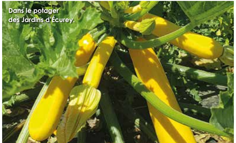
Dans le potager des Jardins d'Écurey.