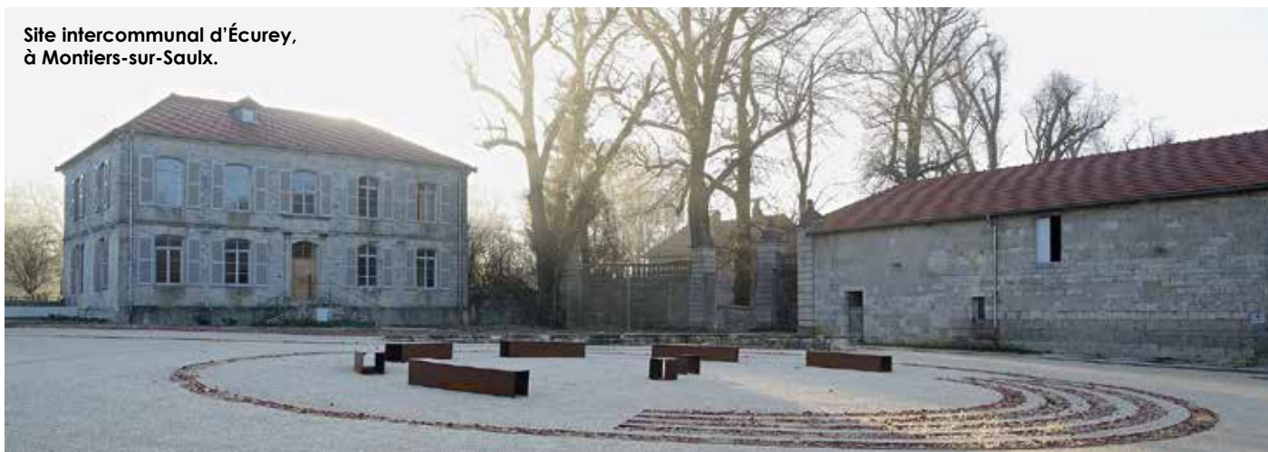
Site intercommunal d'Écurey, à Montiers-sur-Saulx.

Créativité, émulation et fourmillement. Le site intercommunal d'Écurey ne manque ni d'allure ni d'activités. Si le lieu émerveille par son histoire et son patrimoine, il est aussi résolument tourné vers l'avenir avec une aptitude à innover, à former et à construire un mieux vivre ensemble. Et si cette ancienne fonderie était le visage d'une ruralité synonyme de modernité et de dynamisme, capable de faire travailler à l'unisson tous les acteurs du territoire ?