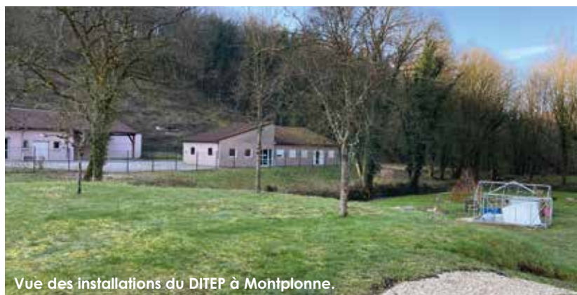
Vue des installations du DITEP à Montplonne.

Douze enfants résident au DITEP L'Avenir de Montplonne. Bien que présentant des troubles du comportement rendant difficile leur inclusion, ils bénéficient d'un cadre adapté à leur handicap et d'une équipe de professionnels dévoués.