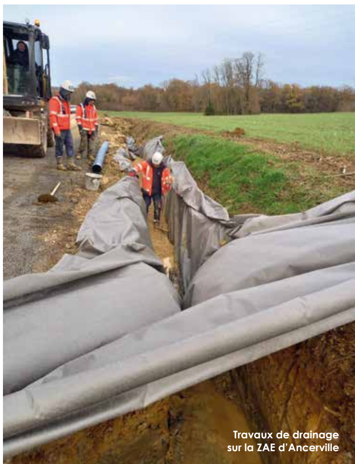
Travaux de drainage sur la ZAE d'Ancerville

Le programme annuel des travaux de voirie sera publié à la fin du mois de juin 2021 par les services de l'intercommunalité.