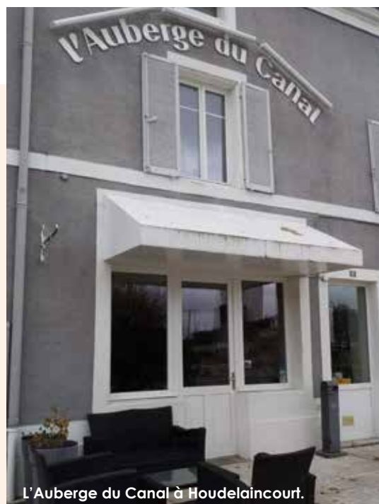
L'Auberge du Canal à Houdelaincourt.