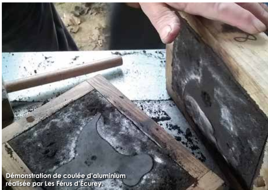
Démonstration de coulée d'aluminium réalisée par Les Férus d'Écurey.

Les Férus sont à leur place à Écurey, haut lieu de l'activité métallurgique meusienne durant plusieurs siècles. L'association présidée par Joëlle LAMETZ rassemble d'anciens salariés des anciennes fonderies et en perpétue l'histoire industrielle en réalisant régulièrement des démonstrations de coulées dans une des halles sur le site. « Nous réalisons uniquement des coulées d'aluminium, pour des raisons techniques et pratiques. La Codecom nous a acheté un four à gaz pouvant chauffer jusqu'à 700 degrés et un petit creuset, ce qui nous permet de fondre l'aluminium et d'offrir l'occasion aux visiteurs de réaliser différents sujets qui prennent forme dans des moules » témoigne la Présidente.