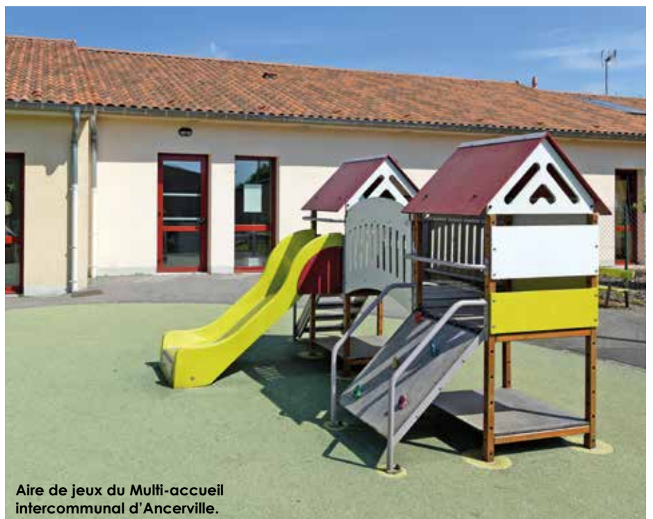
Aire de jeux du Multi-accueil intercommunal d'Ancerville.