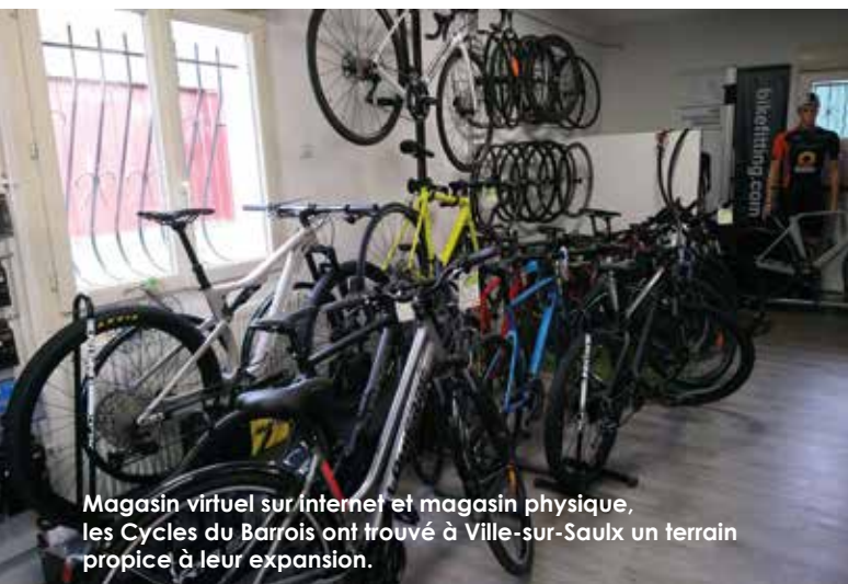
Magasin virtuel sur internet et magasin physique, les Cycles du Barrois ont trouvé à Ville-sur-Saulx un terrain propice à leur expansion.