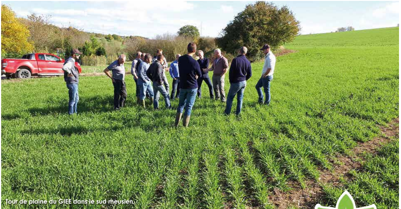
Tour de plaine du GIEE dans le sud meusien.