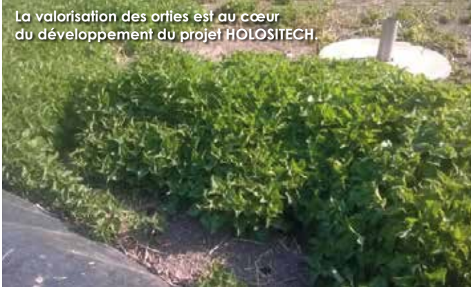
La valorisation des orties est au cœur du développement du projet HOLOSITECH.