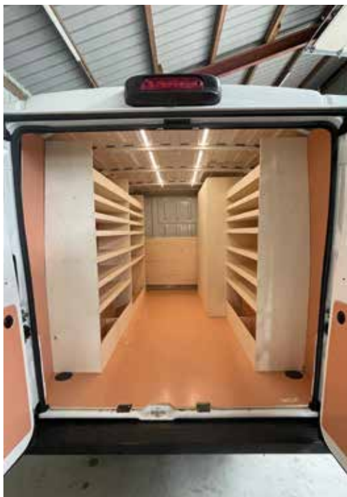
Aperçu d'un aménagement de véhicule réalisé par l'entreprise.

INFO TRAVELLING TURTLE AMENAGEMENT 3 rue des Confins à Cousances-les-Forges Tél. : 03 29 45 08 74