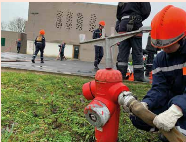
Chaque samedi, les jeunes sapeurs-pompiers suivent des cours théoriques et pratiques au centre de Secours d'Ancerville.

26 adolescents sont actuellement accueillis au centre de Secours d'Ancerville où ils sont formés durant quatre ans pour passer du statut de jeunes sapeurs-pompiers à celui de sapeurs-pompiers volontaires.